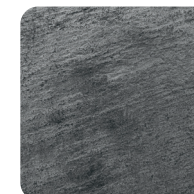
Kostka i łupek