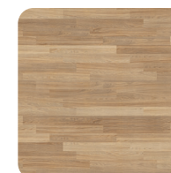
Drewno i panele